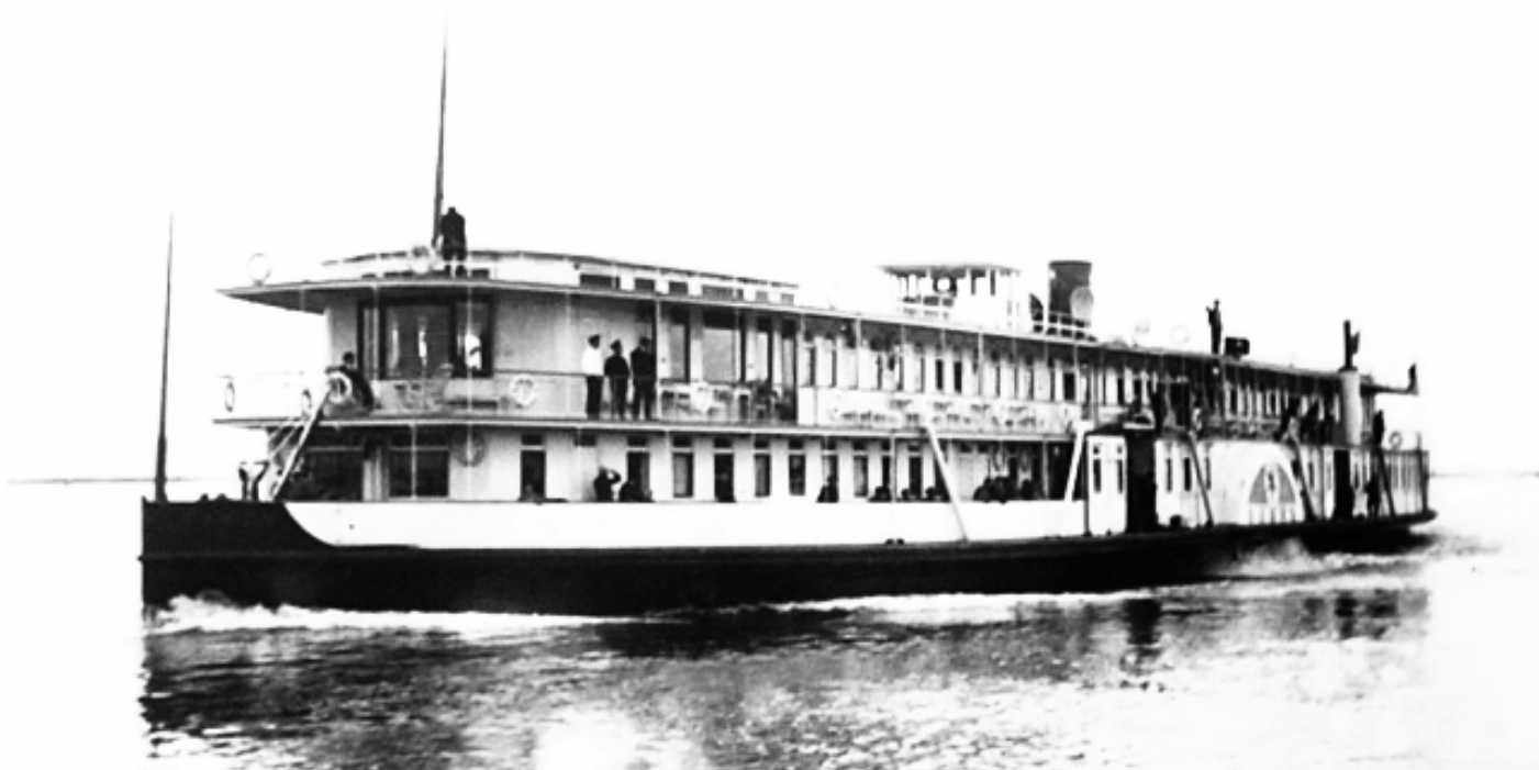
БАЯН переименован в МИХАИЛ КАЛИНИН

ТОВАРО-ПАССАЖИРСКИЙ ПАРОХОД МОЩНОСТЬЮ 1200 и.л.с.