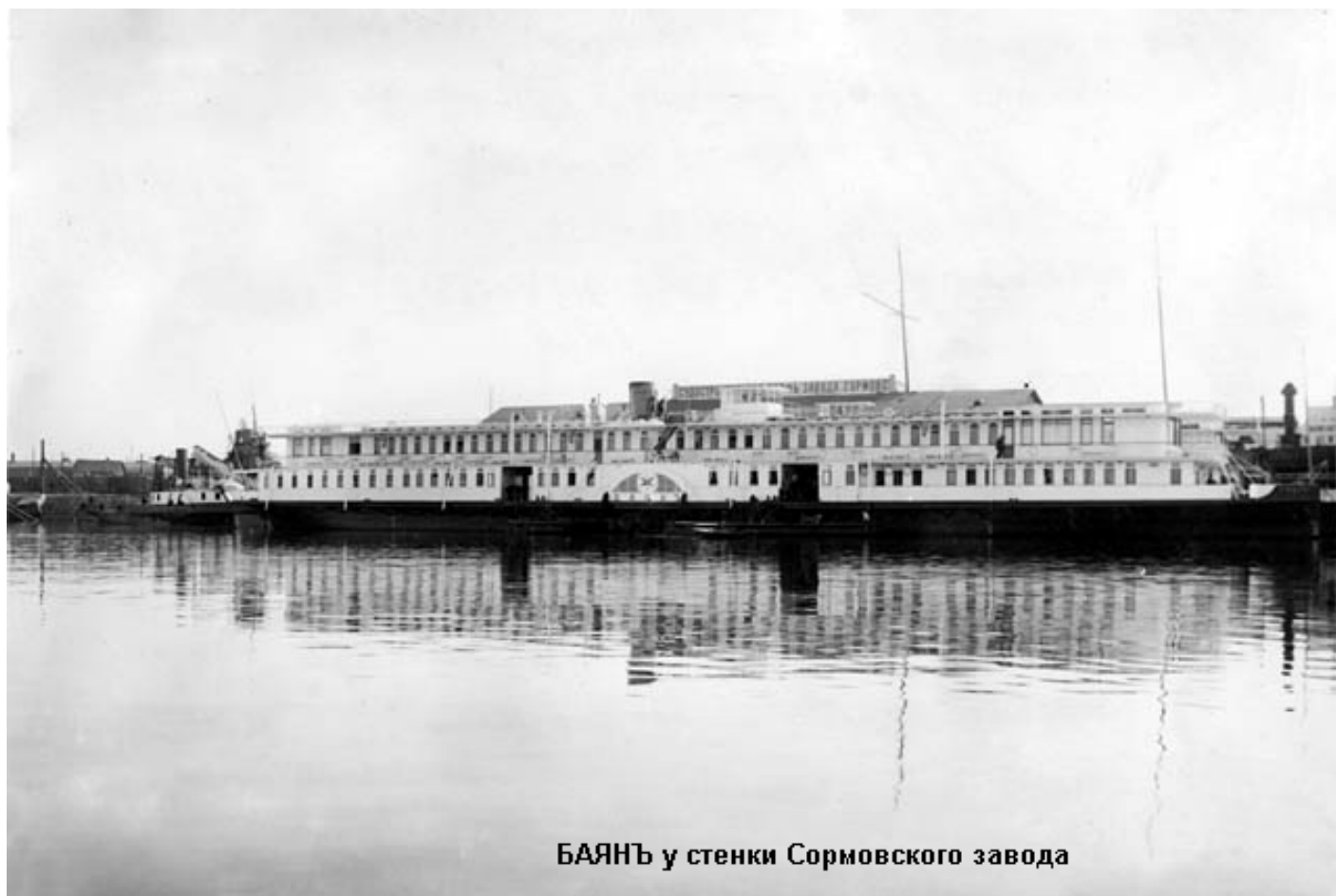
БАЯНЪ у стенки Сормовского завода