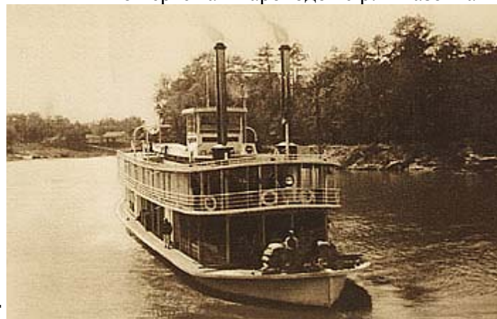
судно – прототип FLINT