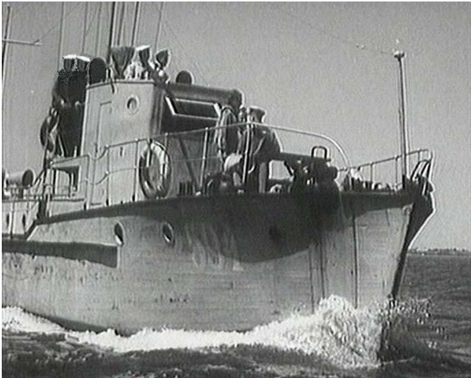
Катер КЭМТШ-594 типа Я-6, послевоенный снимок в составе бригады траления ЧФ. (пусковая реактивная установка демонтирована)