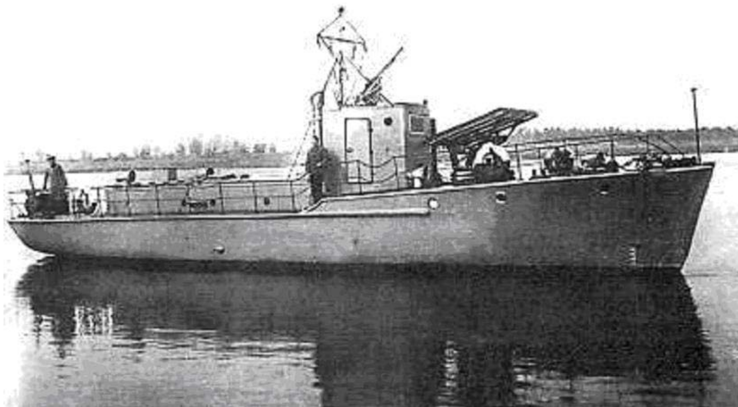
Катер типа Я-6