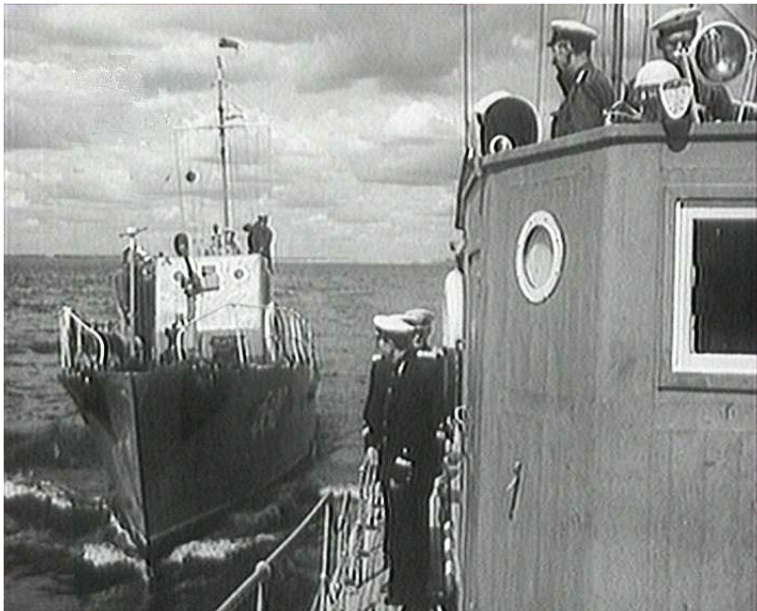
Катер типа Я-5 швартуется к борту катера типа Я-6