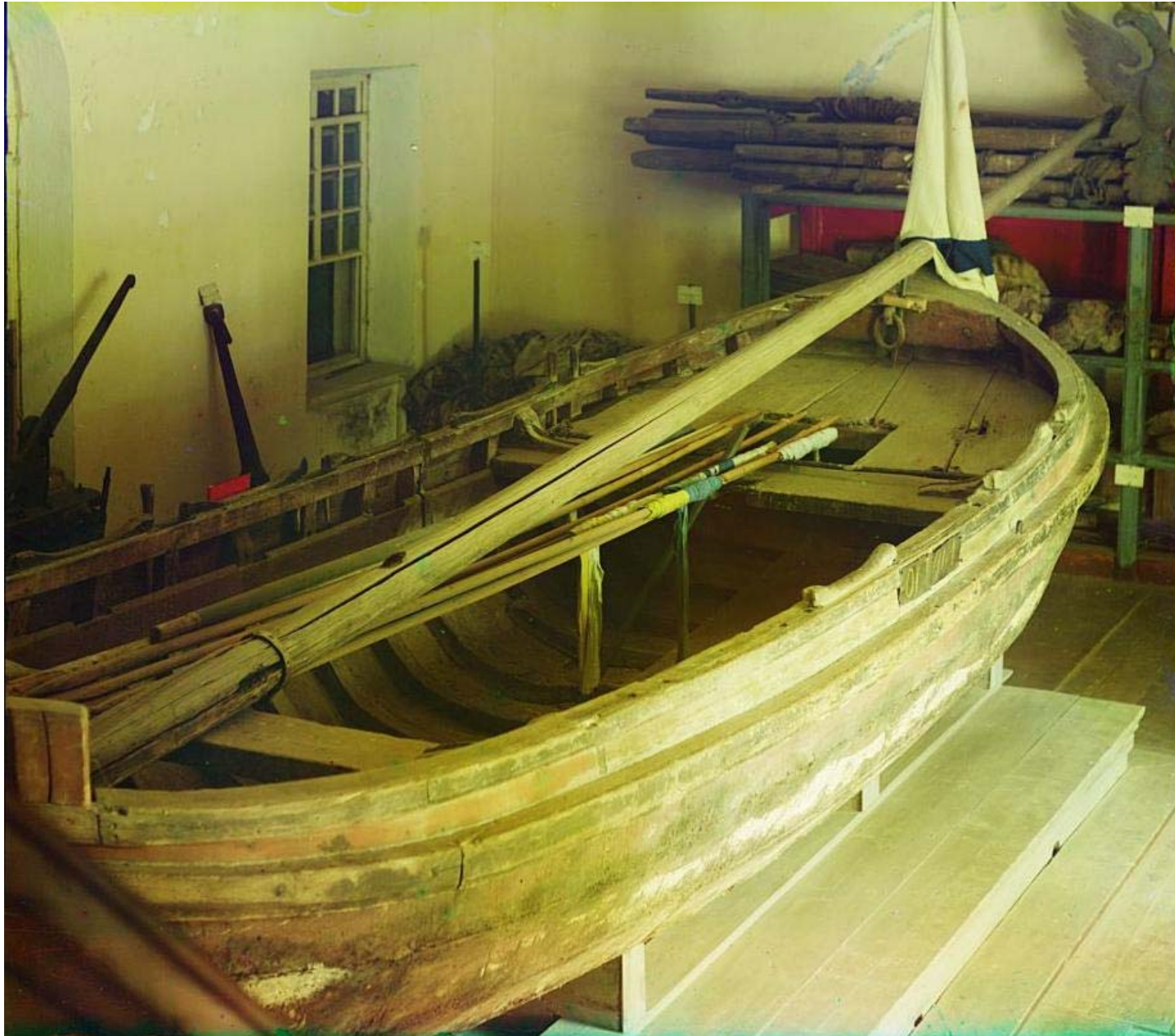
Бот ФОРТУНА (фотографии Прокудина-Горского начала XIX века)