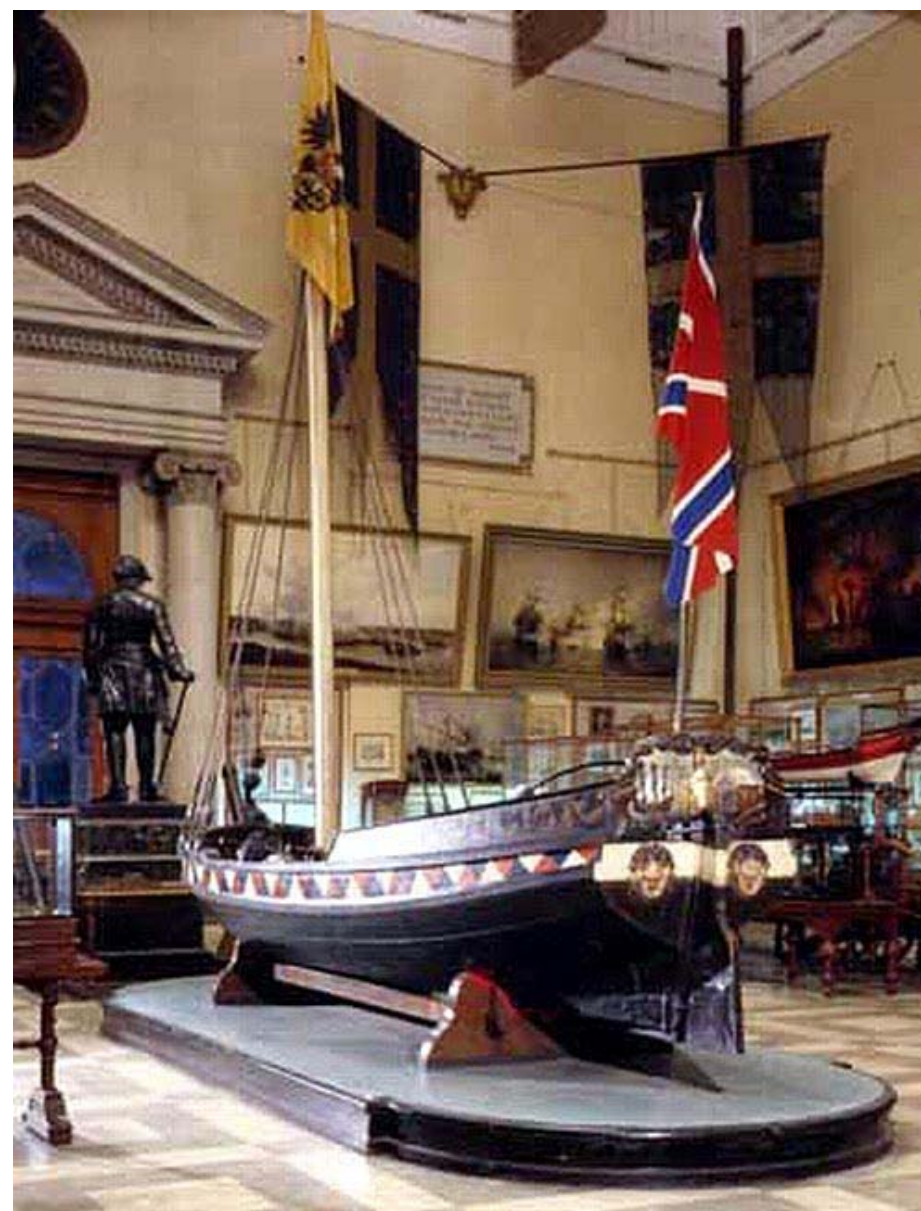
Бот в экспозиции Центрального военно-морского музея