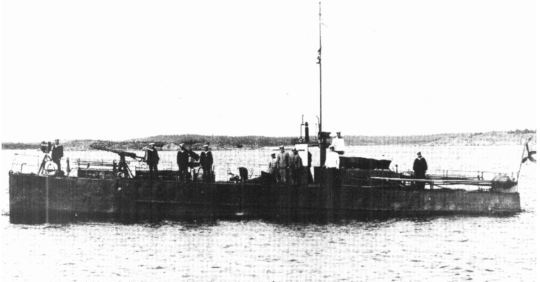
Посыльный катер ШТЫК