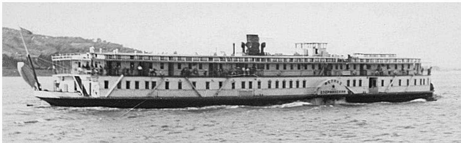
ВАСИЛИЙ ЛАПШИН переименовано в ФЕЛИКС ДЗЕРЖИНСКИЙ