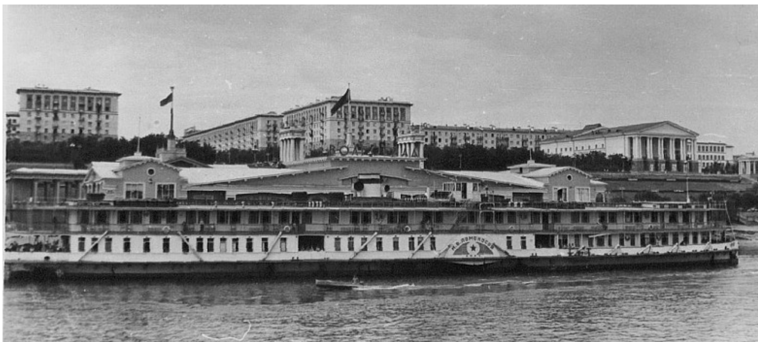
М.В.ЛОМОНОСОВ после модернизации

КАРАМЗИН (1905 г.) сожжен белогвардейцами на р. Чусовой в 1919 г.