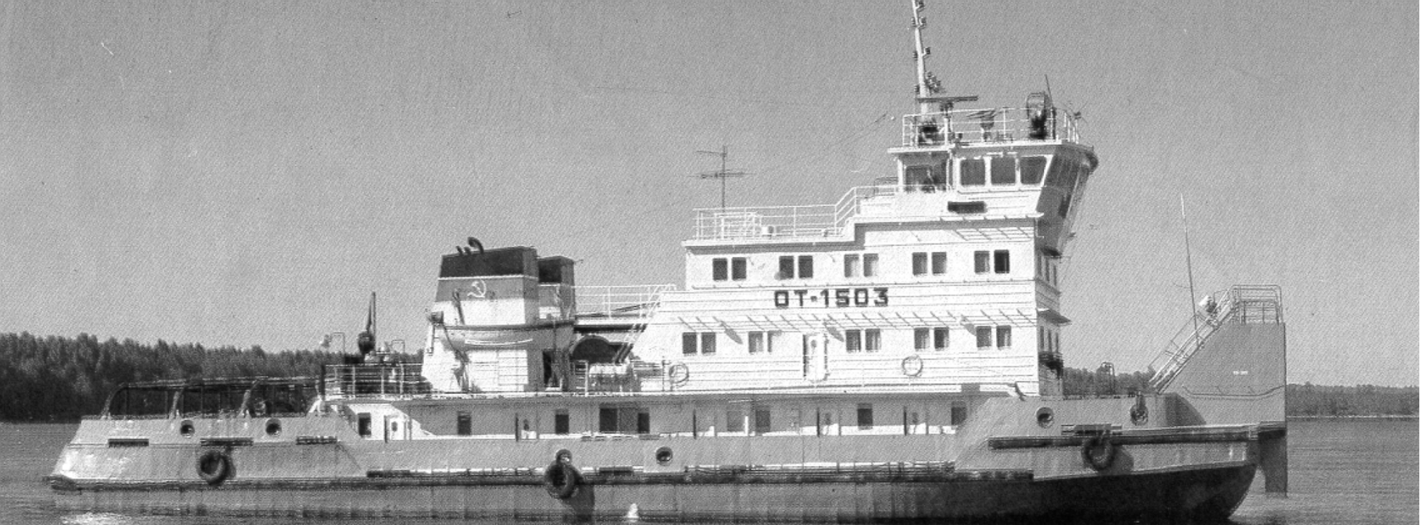
Библиотека корабельного инженера Смирнова